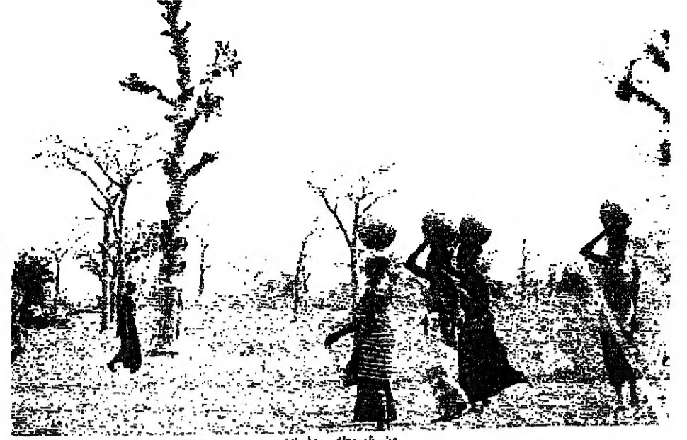
من شريطه «يا أبا»

بساطة، نحاول تقاسم أفكارنا ومشاعرنا. وهذا الجمهور يمكنه المتابعة، هذا جيد. ● في «Yamba» الولد شخص يتعلم النظر... □ أجل، إنه نظري في الفيلم، نقطة ارتباطي مع الماضي، كنت مرغماً على بناء القصة بسبب نوعية اللعب طريقة في التصرف كانت صحيحة إلى حد أنها أصبحت نقطة ارتكازي، أنها شخصية محفوظة أيضاً بامتلاك أم رائعة، عندما يقول والد بيلا، يقول لامرأته، ذلك التي من نيك الأم، هذا لأن كل التربة الأساسية تتحقق مع الأم، الولد هو الذي يتعلم، لا يأتي عقوباً إلى تلك المرأة العجوز وفي البداية، أنه قسراً مثل الآخرين لأنه يحكم (على الناس)، هو أيضاً، لكنه في الوقت عينه، طيب ومتسامح، أنه أيضاً، الذي يقول للمدمن على الكحول، تريد مرافقتي، توقف عن الشراب، إنه مثالي، أنه ليس الطهارة للطفلة لكنه يقود عالم الفلم.